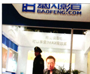
P47 | 公司与产业

产负债表修复进程。一旦央行开始正式介入资产购买，银行股将摆脱坏账的困扰，结束目前的低估状态。