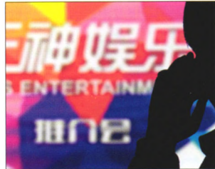
P36 | 公司与产业