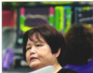
P08 | 速读