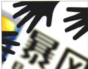
P24 | 特稿