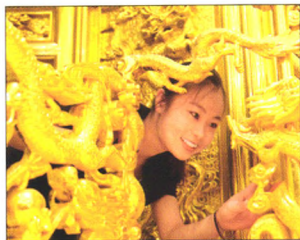
P08 | 速读

自上市以来，博耳电力的收入和净利都保持了高速且稳定的增长，但其远高于同行的毛利率和居高不下的应收账款让人心生疑惑，对公司的一手调研和访谈显示出其核心的配电成套业务在萎缩，公司的持续发展存在隐忧。