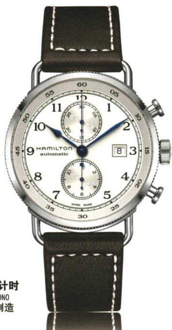
卡其 海军先锋 自动计时 KHAKI NAVY PIONEER AUTOCHRONO 自动机械腕表 瑞士制造 丹丹数据