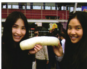
P08 | 速读

都是传统业务，未来增长也面临着重大的不确定性。投资者一厢情愿的把占比低于30%的新兴业务想象成整体业务而给予过高估值，一旦业绩不如预期，立即遭遇戴维斯双杀。