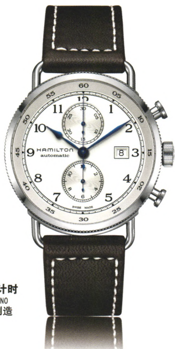
卡其 海军先锋 自动计时 KHAKI NAVY PIONEER AUTOCHRONO 自动机械腕表-瑞士制造 万方数据