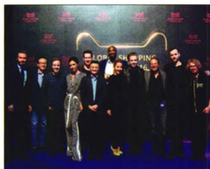
P08 | 速读

刚刚完成总金额近200亿元的并购及配套资金募集不到半年时间,世纪游轮又迅速抛出305.04亿元的并购方案并且再次募集资金50亿元,交易对方也无业绩承诺。史玉柱想将世纪游轮开向何方?