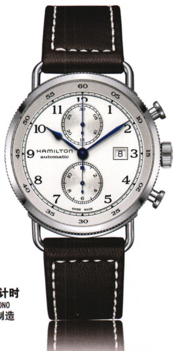
卡其 海军先锋 自动计时 KHAKI NAVY PIONEER AUTOCHRONOM 自动机械腕表-瑞士制造 万方数据