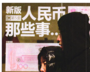
P08 | 速读