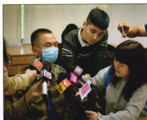
P08 | 速读

不良资产处置业务是一片万亿级的蓝海市场，前途广阔且基本无竞争，是个几乎没有天花板的新兴行业。