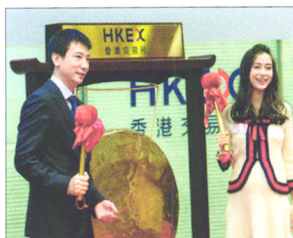
P10 | 速读