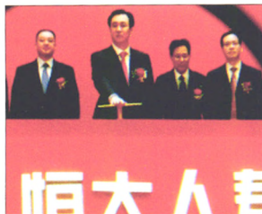
P24 | 特稿