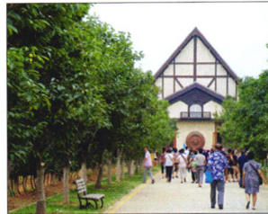
P38 | 公司与产业