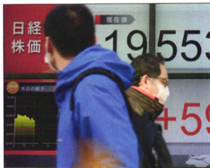
P10 | 速读

资管风险计提政策趋严，信托通道业务价值凸现；低利率市场环境下，高收益率的信托产品优势明显；远低于银行业的不良率，使得信托