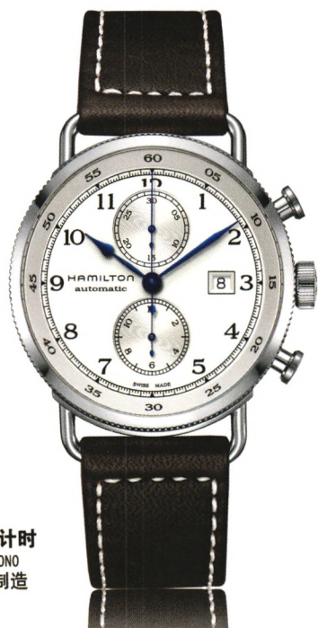
卡其 海军先锋 自动计时 KHAKI NAVY PIONEER AUTOCHRONO 自动机械腕表-瑞士制造 万方数据