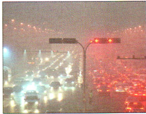
P08 | 速读

如果此轮一线白酒复苏最终能顺利传导至三线，则选股逻辑就很清晰了：重安全选茅台，重弹性、想买牛股，则需要低净利率三线白酒公司中挖掘。