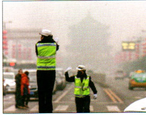
P46 | 公司与产业