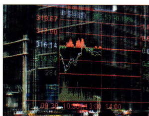
P12 | 速读

从银广夏开始，低成本、难核查的海外业务成为造假者的理想选择。业绩暴涨、估值暴涨、股价暴涨，然后是泡沫破灭。历史反复上演，至今如此。