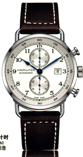
卡其 海军先锋 自动计时 KHAKI NAVY PIONEER AUTOCHRONO 自动机械腕表 瑞士制造