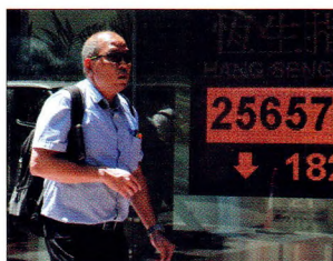
P08 | 速读

尽管严监管，去杠杆已成为行业常态，但由于券商风险释放较为充分，加上行业估值已临近历史底部，较高的ROE使券商股的净资产仍具备