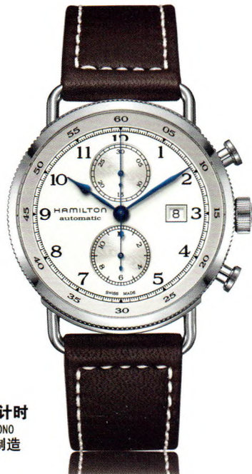
卡其 海军先锋 自动计时 KHAKI NAVY PIONEER AUTOCHRONO 自动机械腕表 瑞士制造