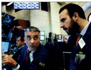
P08 | 速读

不靠实实在在的经营，靠着会计估计变更，一些公司也能“多收三五斗”，或保增长，或避亏损。