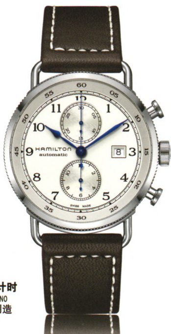
卡其 海军先锋 自动计时 KHAKI NAVY PIONEER AUTOCHRONO 自动机械腕表-瑞士制造 万方数据