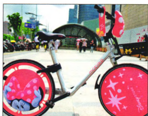
P10 | 速读