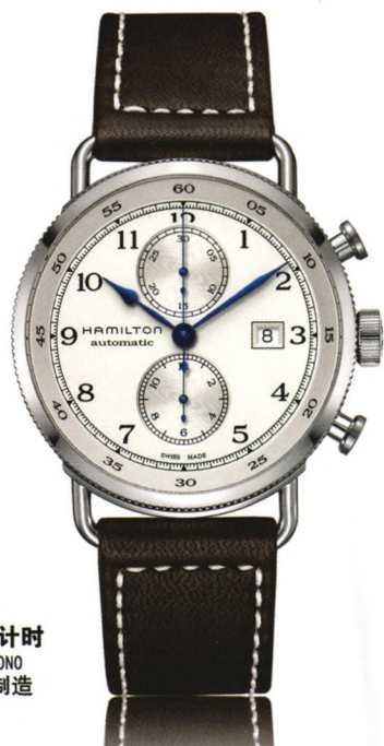
卡其 海军先锋 自动计时 KHAKI NAVY PIONEER AUTOCHRONO 自动机械腕表-瑞士制造 万方数据