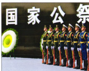
P10 | 速读

P48 险企利率敏感性降低 “134号文”限制了年金类产品,但是对长期保障型产品