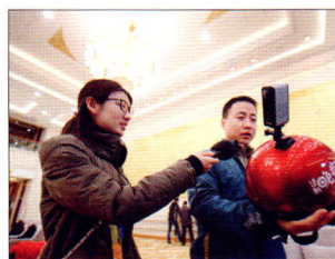
P08 | 速读

如果2017年不调整出厂价，由于消费税税基的提高，全年营业利润率同比下降约2%，加上毛利率总体下降，全年营业利润率可能将下降到58%左右。