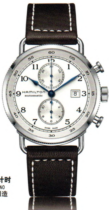
卡其 海军先锋 自动计时 KHAKI NAVY PIONEER AUTOCHRONO 自动机械腕表 瑞士制造 百万数据