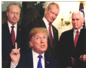
P10 | 速读

现代制药于2016年大手笔并购9家公司，当年整体表现不错，超额完成业绩承诺。但2017年却是另一番情形，大多未完成业绩承诺。