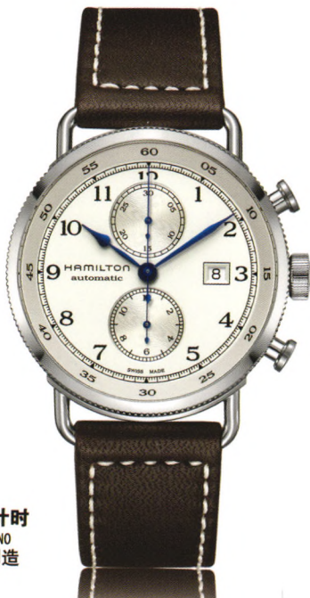
卡其 海军先锋 自动计时 KHAKI NAVY PIONEER AUTOCHRONO 自动机械腕表-瑞士制造 万方数据