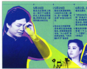
P08 | 速读

继大幅资产减值后,又遭遇股票质押式回购交易业务被暂停6个月的处罚,在激进经营的背后,西部证券股票质押业务风控缺失的黑洞究竟有多大值得关注。