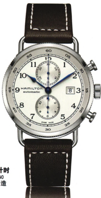
卡其 海军先锋 自动计时 KHAKI NAVY PIONEER AUTOCHRONOM 自动机械腕表-瑞士制造 万方数据