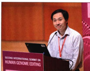
P08 | 速读

三季度数据显示，银行业分化现象更加显著——国有大行带动商业银行资产增速走高，股份制银行受益同业负债成本下降利润亮眼；与农商行基本面出现边际改善的趋势相比，非上市城商行资产质量恶化趋势明显。