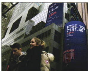
P08 | 速读

资产规模增速从前两年的50%回落至2017年的24.65%，尽管当前的净息差表现已有所改善，但与2016年2.95%的水平相比仍有一定的差距，加上成本收入比也有一定的上升，贵阳银行未来仅靠规模扩张拉动业绩增长有难度。