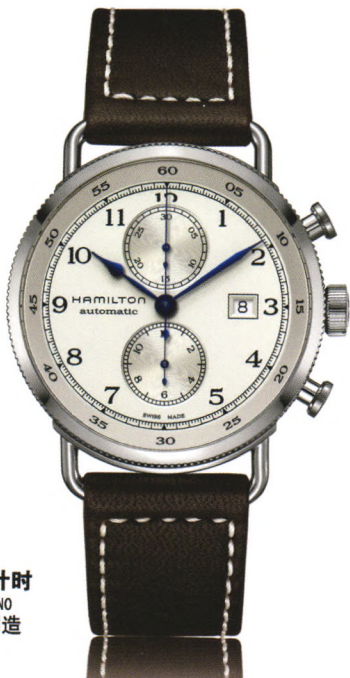
卡其 海军先锋 自动计时 KHAKI NAVY PIONEER AUTOCHRONO 自动机械腕表-瑞士制造