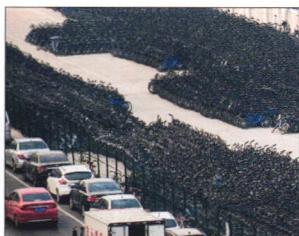
P08 | 速读

四季度监管数据显示，2017年，银行业ROE只有12.65%，同比环比均出现下降。强监管在降低银行业潜在风险的同时，也打破了市场对银行不良的担忧，但能否破除银行估值的天花板仍有待观察。