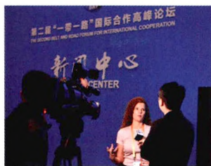
P08 | 速读

虽然国际间的货币并无明面上的等级划分，但优质货币与优质商品类似，贸易商对优质货币的追逐，显然是对货币后面的国家实力的认