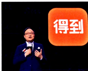
P08 | 连载

隐形债务置换所形成的信贷增量对投资的实际拉动有限；加上LPR后续存在下调预期也使银行有提前放贷