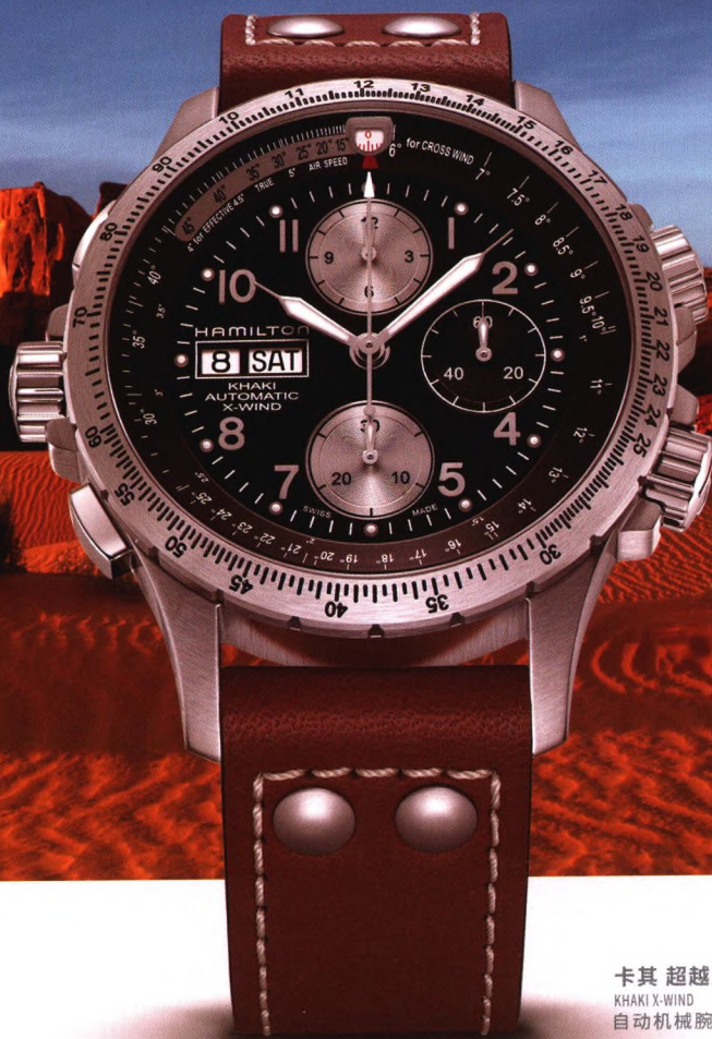
卡其 超越风速 KHAKI X-WIND 自动机械腕表