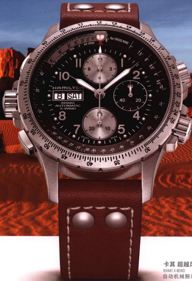
卡其 超越风速 KHAKI X-WIND 自动机械腕表