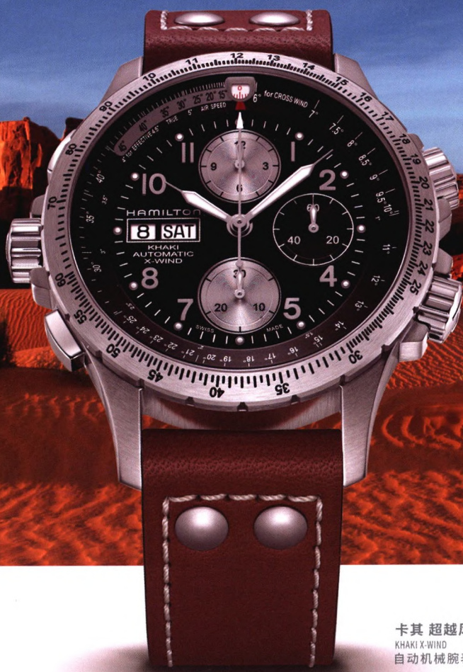
卡其 超越风速 KHAKI X-WIND 自动机械腕表