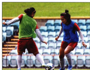
P16 | 宏观

品的附加费用率上限、现金价值及参数做出了相应的调整，以降低价格、控制费用、提升现金价值等手段刺激保障型产品的发展，在提升保障型产品及长期储蓄型产品的吸引力的同时，适时顺应当前形势的发展，补齐保精算制度体系，填补监管制度空白。