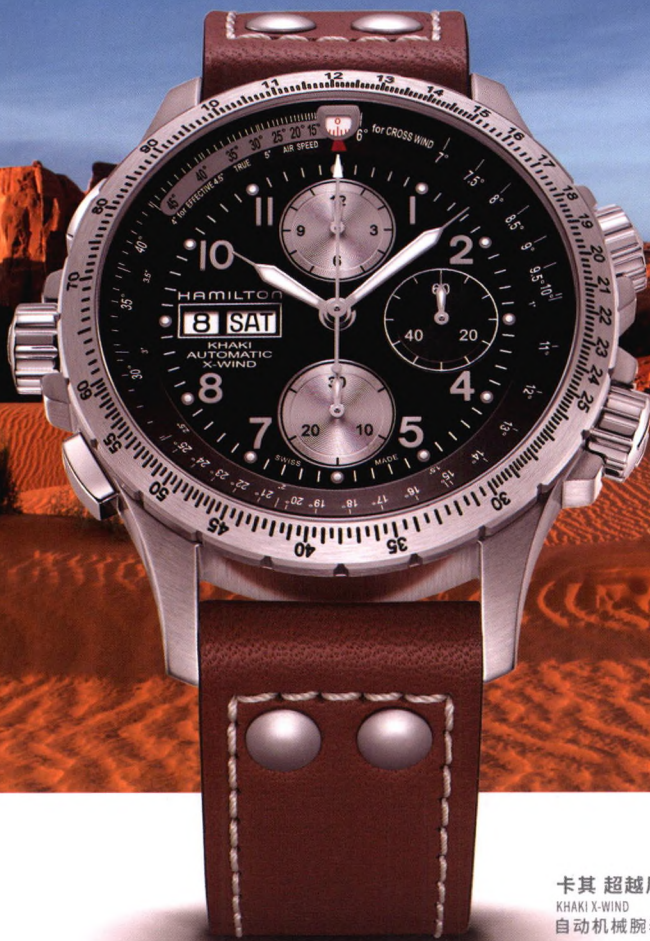
卡其 超越风速 KHAKI X-WIND 自动机械腕表