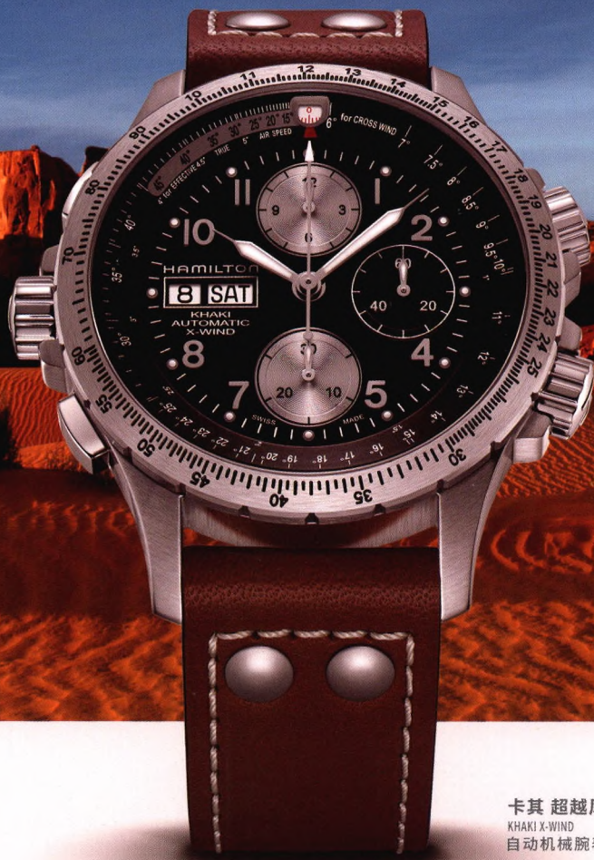
卡其 超越风速 KHAKI X-WIND 自动机械腕表