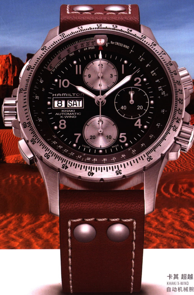
卡其 超越风速 KHAKE X-WIND 自动机械腕表