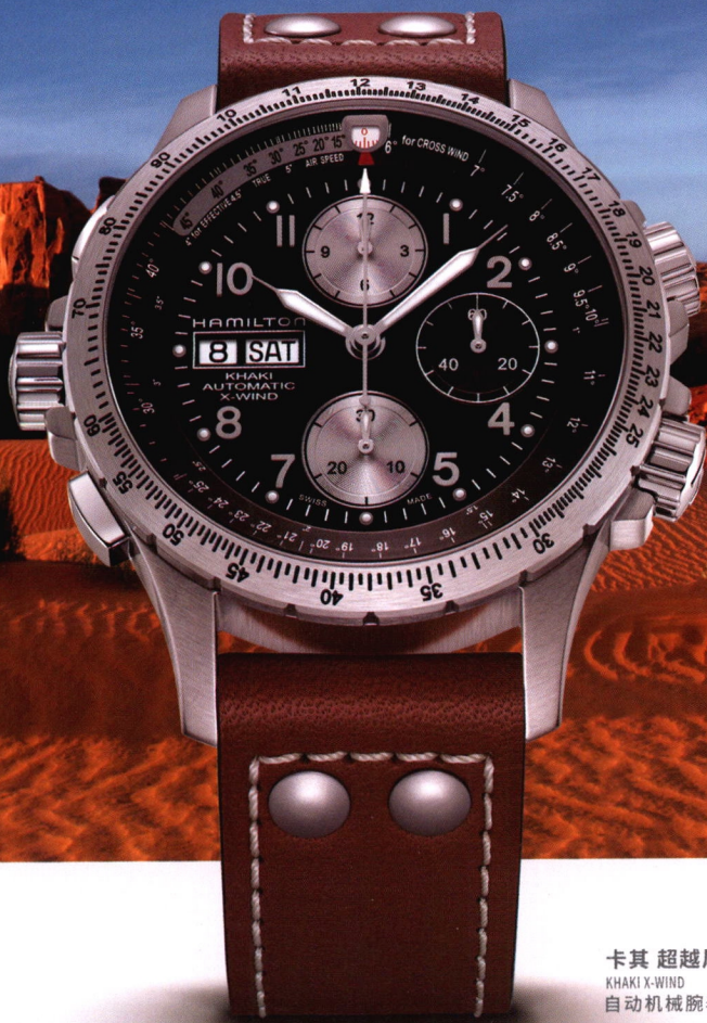
卡其 超越风速 KHAKI X-WIND 自动机械腕表