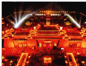
P08 | 速读