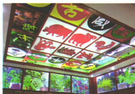
药性理论与灯箱标本展示图