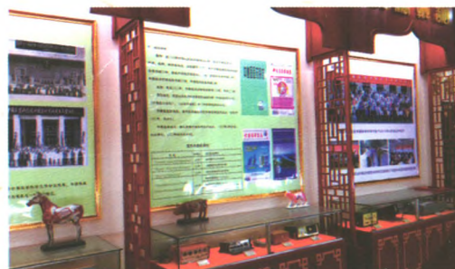
文化展示(重要会议、期刊及学术交流活动的)