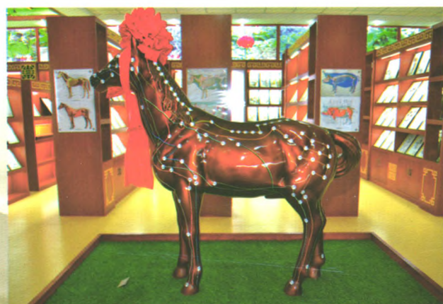
马体针灸穴位经络模型