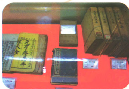
中兽医古籍(不同版本《元亨疗马集》)