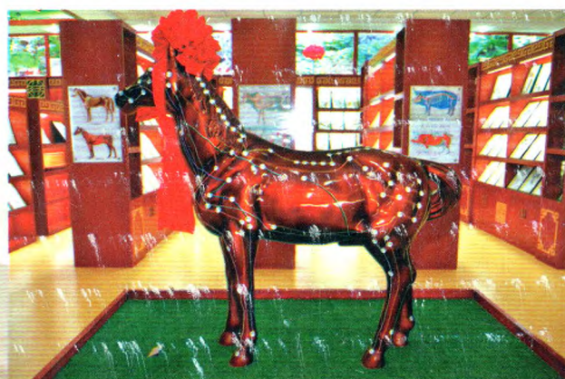
马体针灸穴位经络模型