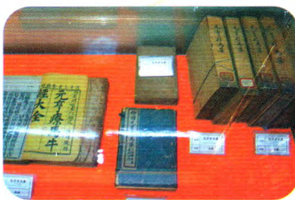
中兽医古籍(不同版本《元亨疗马集》)