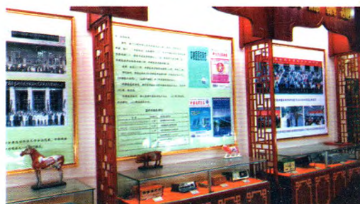
文化展示(重要会议、期刊及学术交流活动)