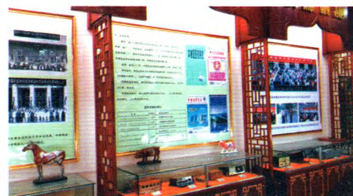
文化展示(重要会议、期刊及学术交流活动)