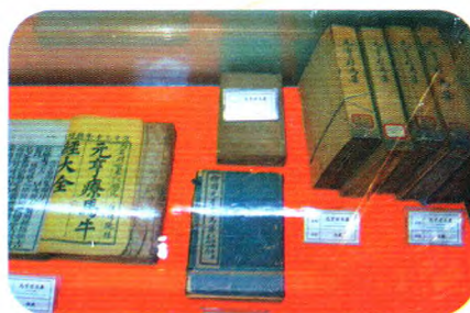
中兽医古籍(不同版本《元亨疗马集》)