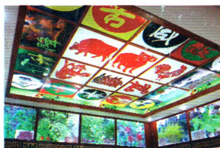
药性理论与灯箱标本展示图