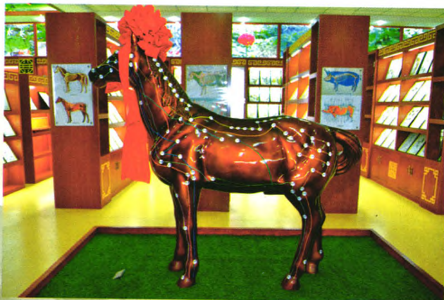
马体针灸穴位经络模型