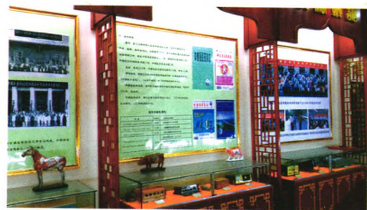
文化展示(重要会议、期刊及学术交流活动)