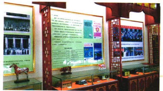
文化展示(重要会议、期刊及学术交流活动)