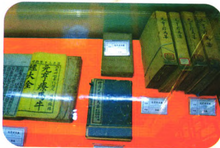
中兽医古籍(不同版本《元亨疗马集》)