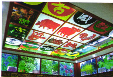
药性理论与灯箱标本展示图