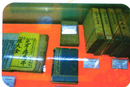
中兽医古籍(不同版本《元亨疗马集》)