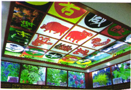
药性理论与灯箱标本展示图