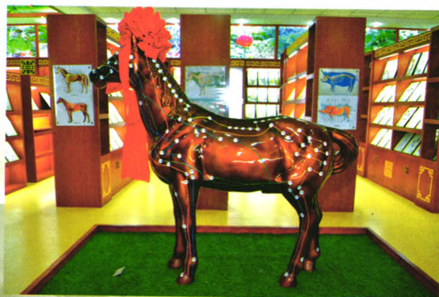
马体针灸穴位经络模型