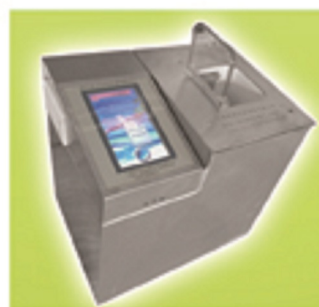
高智能高精度量热仪