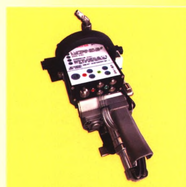
一键式气电一体打包机