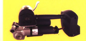
大收紧力电动打包