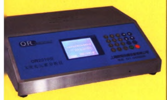
超灵敏X荧光钙铁仪