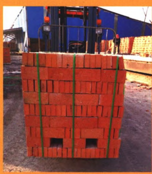
第四代自动穿带 无托打包系统