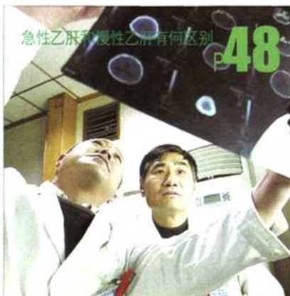
急性乙肝和慢性乙肝有何区别