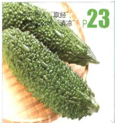
向广州人“取经”, 夏季怎么吃“清凉”