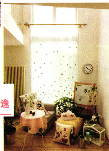
P124 淡雅纱帘，让空间更飘逸