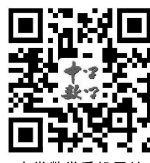
中学数学手机网站