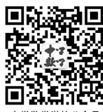
中学数学微信公众号

95 巧借课堂提问打造高效数学课堂 ——以“直线斜率与方程”一轮复习教学片断为例 ..... 王 琪