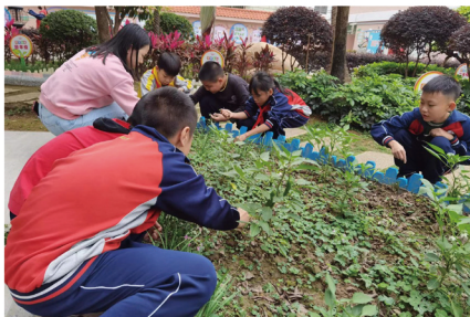
◆ 学生在劳动课上体验种植