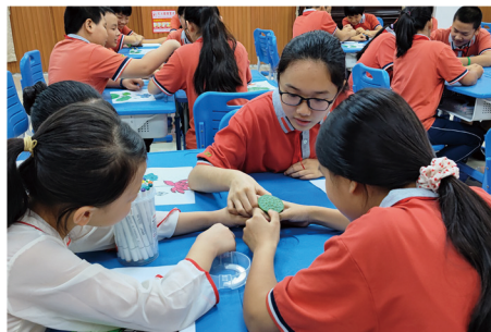
◆ 学生在“心如夏荷 逐阳而生”心理课上剥莲子

向阳成长，春花灿烂。今后，学校将继续开展关爱学生心理健康的系列活动，发挥作为心理健康教育示范校的示范引领作用，助推学生向阳成长。