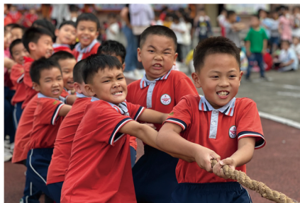
◆ 二年级趣味运动会：拔河