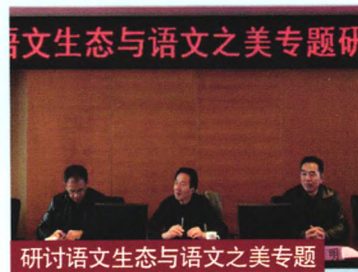
研讨语文生态与语文之美专题