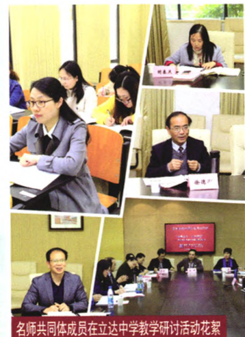
名师共同体成员在立达中学教学研讨活动花絮