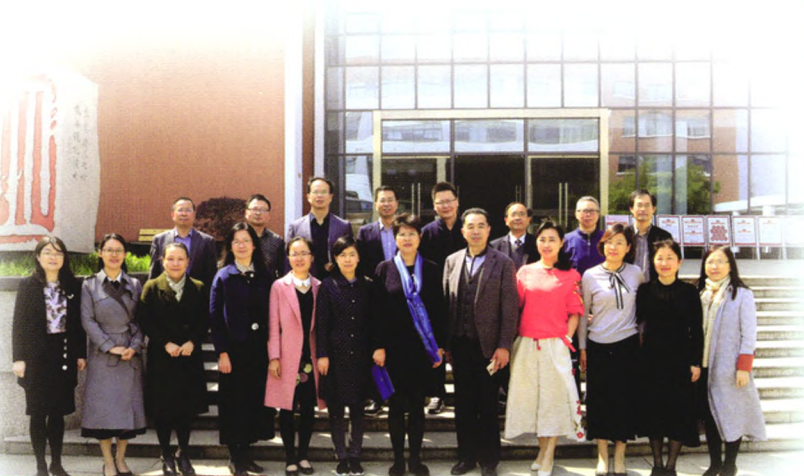
名师共同体成员活动留影