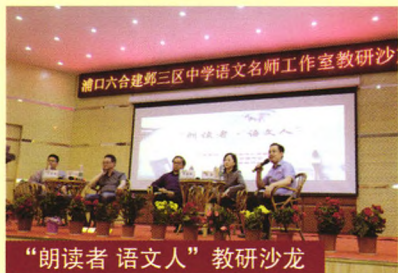
“朗读者 语文人”教研沙龙