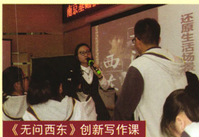
《无问西东》创新写作课