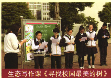
生态写作课《寻找校园最美的树》