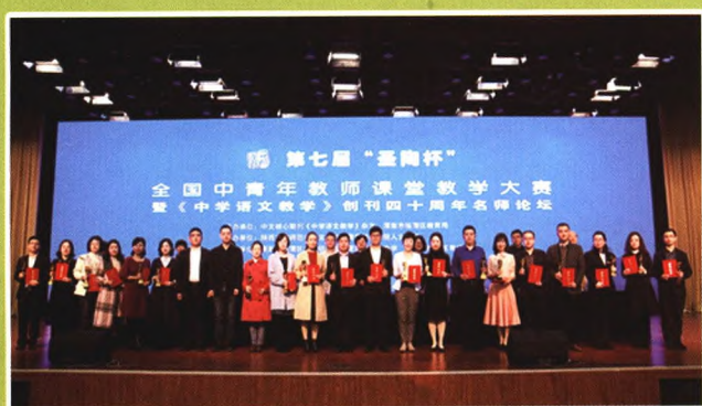
获奖选手与专家合影