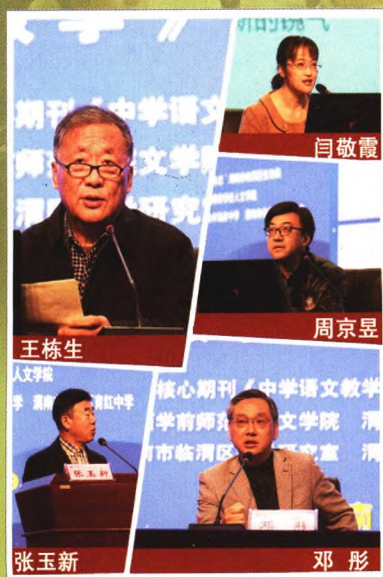
《中学语文教学》创刊四十周年名师论坛