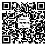
《中学语文教学》官方微信

读者如发现印刷质量问题,影响阅读, 请与印刷厂联系。电话:010-61732313