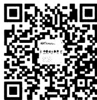
《中学语文教学》官方微信

读者如发现印刷质量问题,影响阅读, 请与印刷厂联系。电话:010-61732313