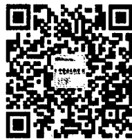
《中学语文教学》官方微信

读者如发现印刷质量问题,影响阅读, 请与印刷厂联系。电话:010-61732313