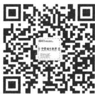
《中学语文教学》官方微信

读者如发现印刷质量问题,影响阅读, 请与印刷厂联系。电话:010-61732313