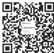
《中学语文教学》官方微信

读者如发现印刷质量问题,影响阅读, 请与印刷厂联系。电话:010-61732313