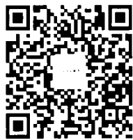
《中学语文教学》官方微信

读者如发现印刷质量问题,影响阅读, 请与印刷厂联系。电话:010-67584284