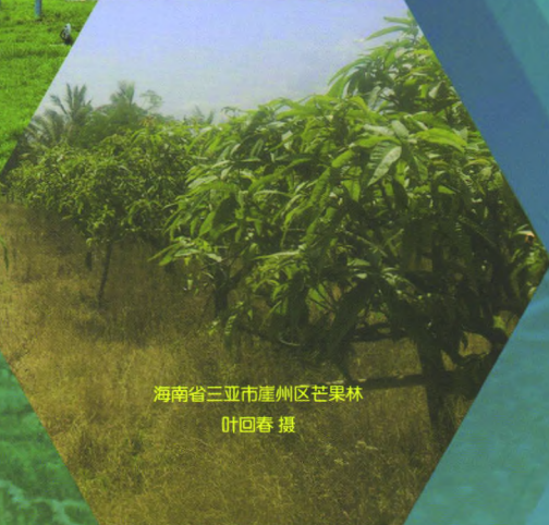
海南省三亚市崖州区芒果林 叶回春 摄